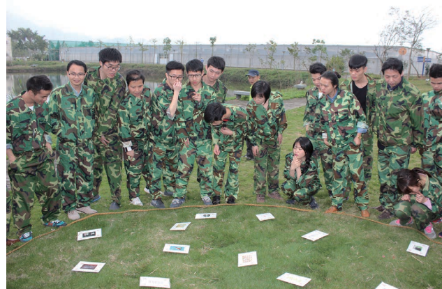
图为“急速60秒”游戏环节