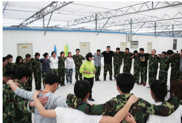
图为参训学员“破冰环节”