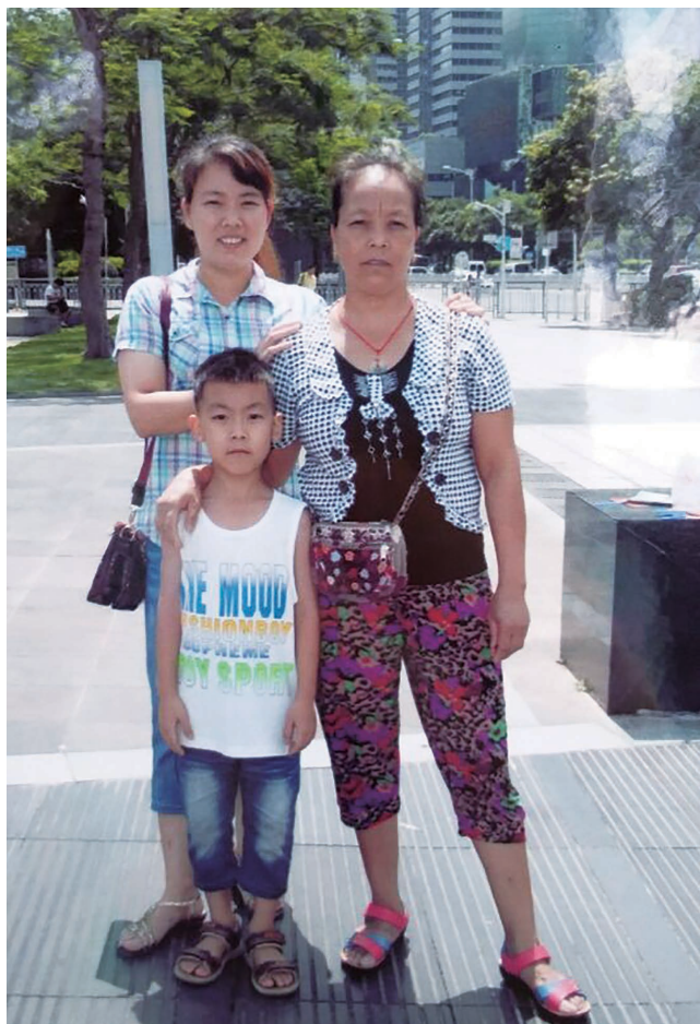
本文作者与母亲、小孩在深圳留影

窗外一片乌黑，雨点打在头顶上的瓦房，黄泥混着水从墙角涌下，破烂的厨灶晃动着一个矮小佝偻的身影，您还在忙碌着。