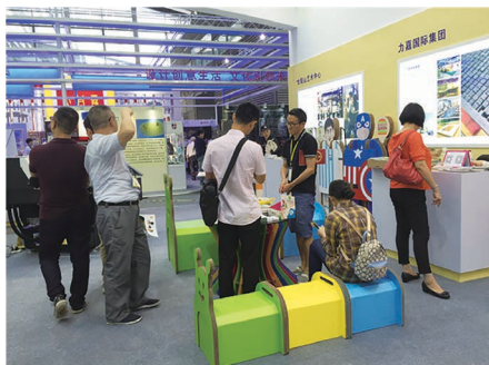
游客坐的是毛毛虫造型的凳子