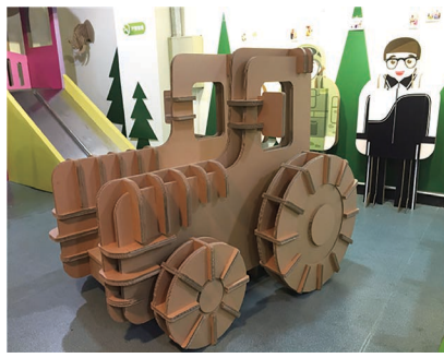
瓦楞纸做的拖拉机