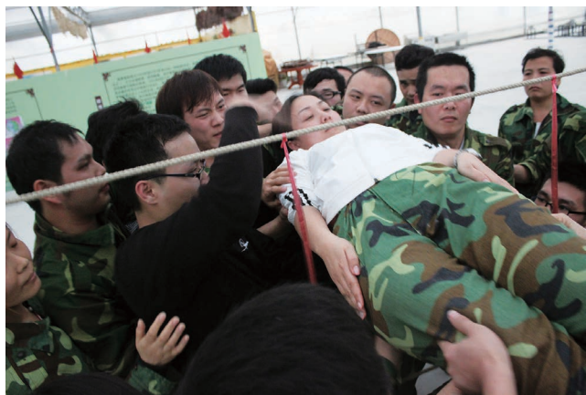
学员们在进行终极挑战——穿越黑洞