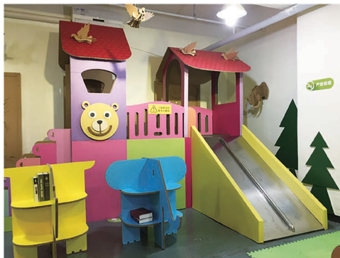
瓦楞纸做的滑滑梯