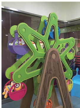
瓦楞纸做的摩天轮