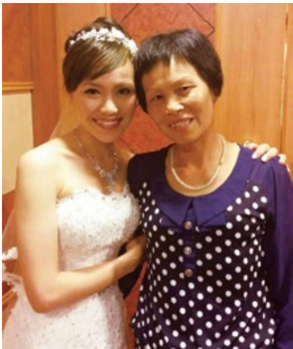
图为本文作者与母亲合影

亲爱的妈妈，在女儿即将出嫁前，我想对您说感谢您的养育、教育之恩，感谢您的付出、关爱、包容之恩。